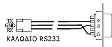
Σχήμα 2: Καλώδιο RS232

19200 baud, 8 bit, no parity. Transmit delay = 40msec/char.